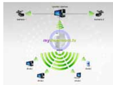
Schéma vysílání one-to-many pomocí služby MyShowroom.TV

Vše co potřebujete ke zprovoznění vysílání je počítač s webkamerou a náš vysílací software a přístup k internetu. Vyžadujete-li kvalitnější obraz, můžete připojit klasickou či digitální, případně Full HD kameru (připojení přes IEEE1394 nebo videokartu). Jako zdroj obrazu můžete použít také snímání obrazovky počítače, nahrané video, prezentaci, atd. Naše technologie podporuje i vysílání z více zdrojů zároveň – divák si může vybrat, na co se bude dívat pomocí picture-in-picture (obraz v obrazu).