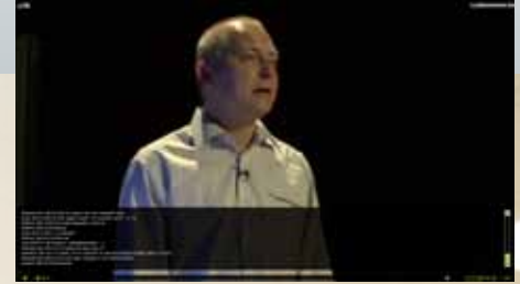
Díky vestavěnému chatu mohou diváci klást přednášejícímu během přímého přenosu i své dotazy

Jako nejlepší se nakonec ukázalo řešení MyShowroom.TV, které je postaveno na technologii Microsoft Silverlight. Díky ní je umožněno kvalitní streamování až ve Full HD rozlišení při relativně nízkém datovém toku (v porovnání s konkurenční technologií Flash). Vysílat je navíc možné až ve třech různých kvalitách současně. Nechybí ani podpora smoothstreaming, kdy se kvalita mění automaticky dle rychlosti připojení diváka.